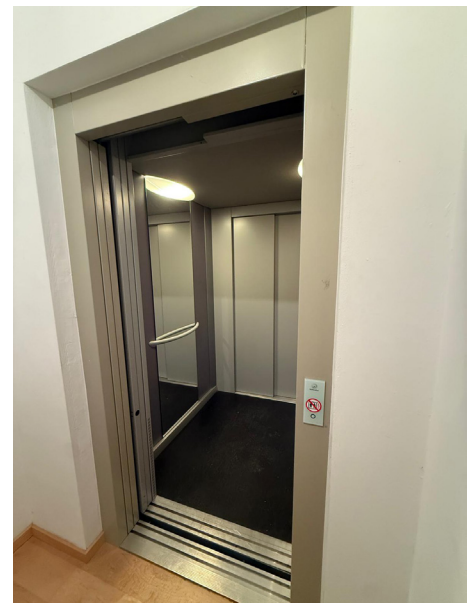
Aufzug im Treppenhaus